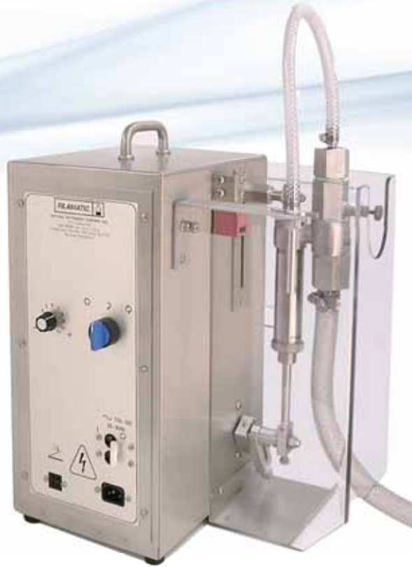
AB Series – Máquina para Trabajos Medianos